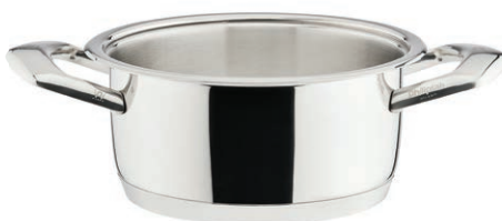
Gryte Ø 20 cm poj. 4 l