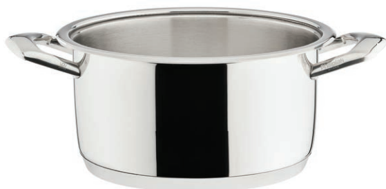
Gryte Ø 24 cm poj. 6 l