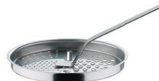
Rivjern + slikkepott