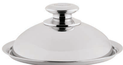
Kuleformet lokk Ø 24 cm