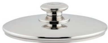
Lokk Ø 24 cm