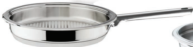
Stekepanne Ø 24 cm