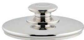
Lokk Ø 20 cm