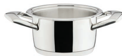
Gryte Ø 16 cm poj. 2 l