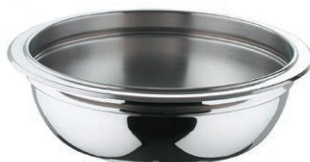
Bolle Ø 20 cm